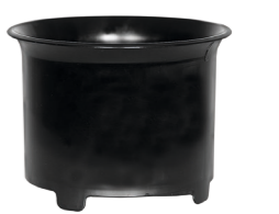
Serienmäßig: Zykloneinsatz Art.-Nr. 109.057