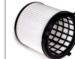
Serienmäßig: EPA12 Feinstaub-Filterpatrone Art.-Nr. 109.058